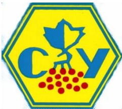
ВГО «Союз Українок»