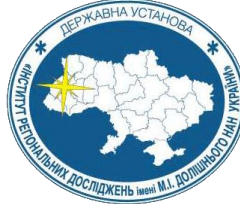
ДУ «Інститут Регіональних досліджень імені М.І. Долішнього НАН України»