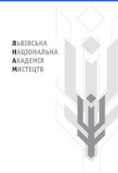
Львівська національна академія мистецтв