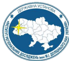
ДУ «Інститут Регіональних досліджень імені М.І. Долішнього НАН України»